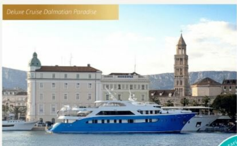
MV SAN ANTONIO or similar