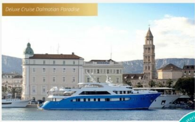
Deluxe Cruise Dalmatian Paradise