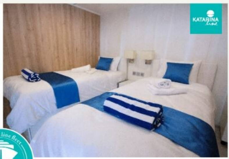
MV SAN ANTONIO or similar