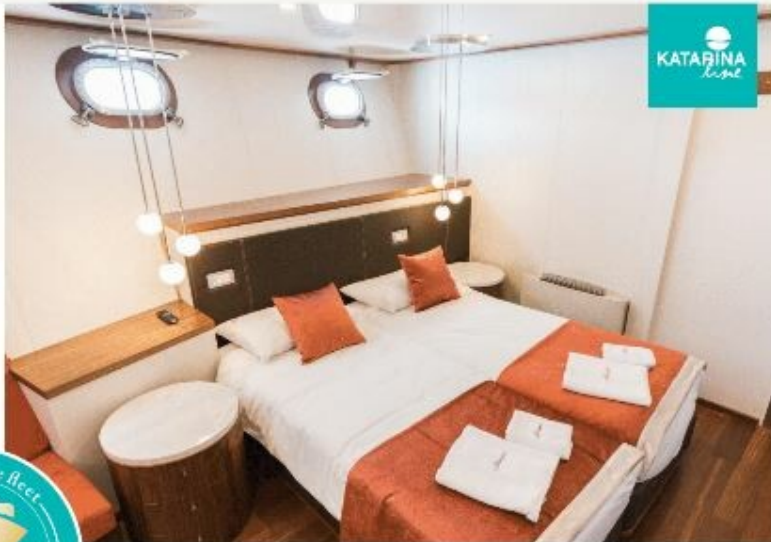
MV AVANGARD or similar