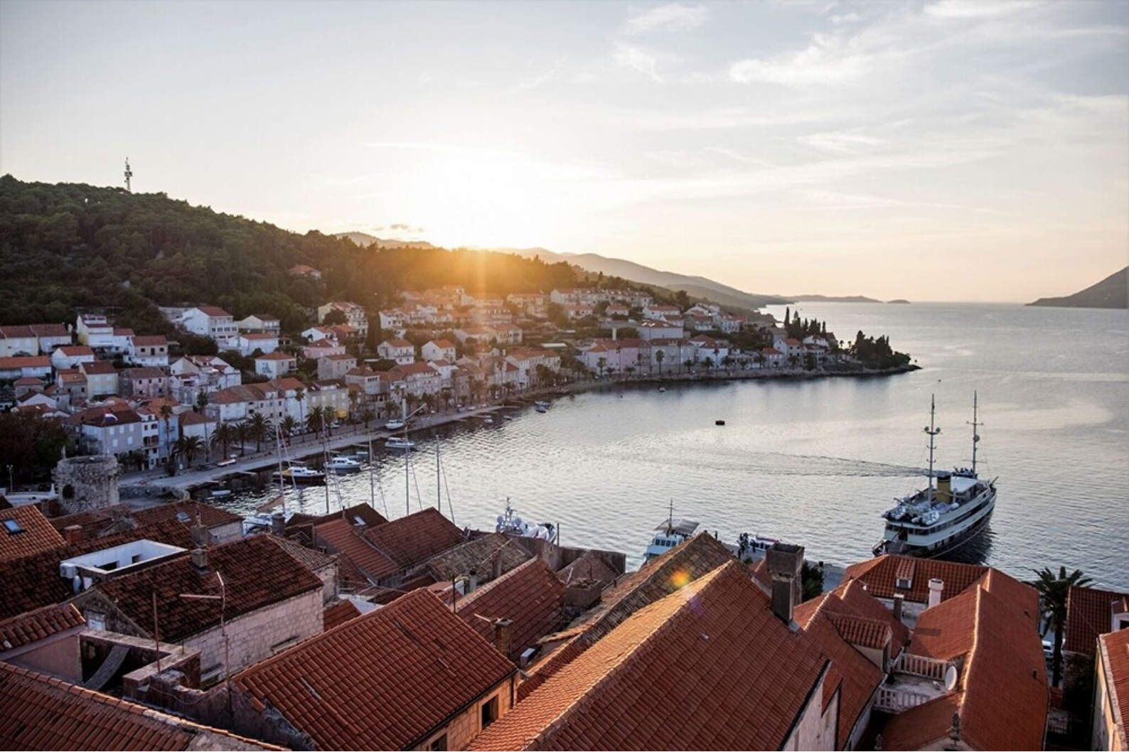
Deluxe Cruise Dalmatian Paradise