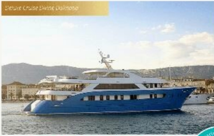
MV SAN ANTONIO or similar