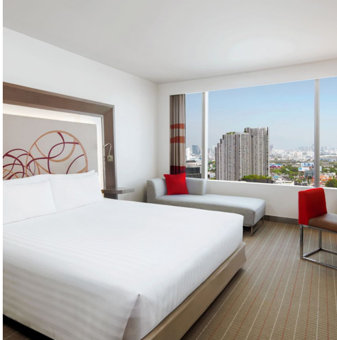
PUKHET: Duangjitt Resort & Spa 4* superior -deluxe garden wing sobe